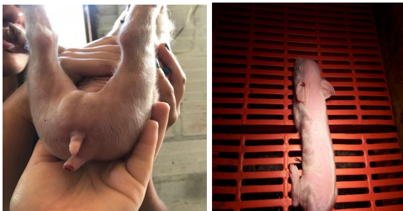
Figura 1. Lechones para castración quirúrgica(edad).

especial si los que la ejecutan son personas sin experiencia (Anónimo, 2001)