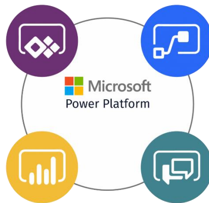
Ilustración 2. Power Platform

Es un conjunto de herramientas de Microsoft integradas dentro de Office 365 preparadas para analizar, crear soluciones y automatizar los procesos de una empresa (KeD Microsoft Partner, n.d.).