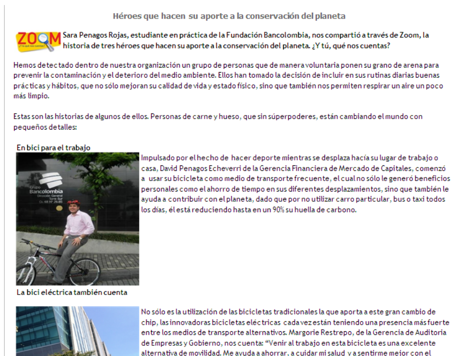
Ilustración 5: Nota periodística héroes por la conservación del planeta

Resaltar los logros obtenidos, gracias a las buenas prácticas sociales y ambientales, es otra forma de crear consciencia dentro de los colaboradores del Banco, sobre la importancia de