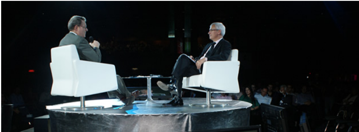
Ilustración 5 Foro E Medellín 2008.