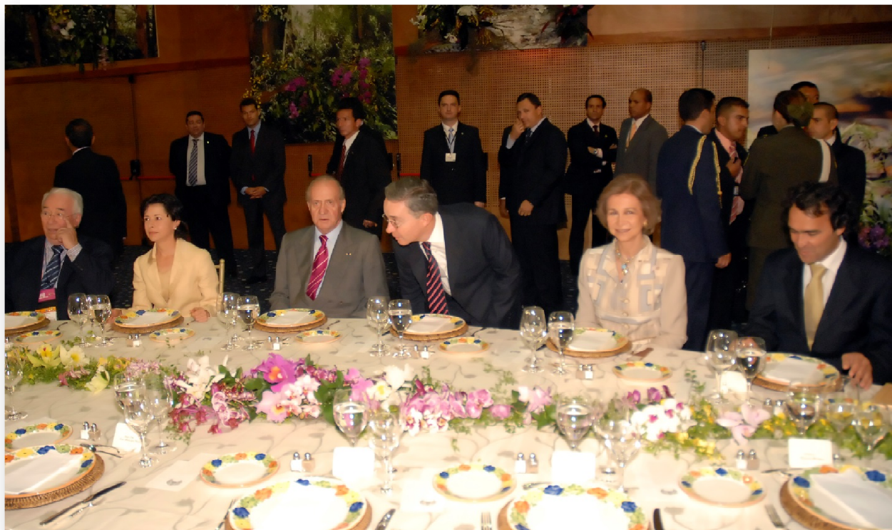
Ilustración 3 Almuerzo - Visita Reyes de España, Medellín