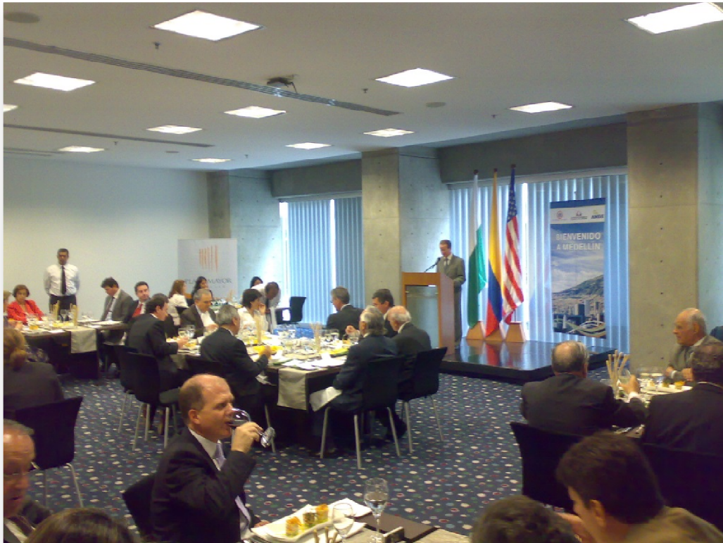
Ilustración 2 Almuerzo Embajador de Estados Unidos, Plaza Mayor.