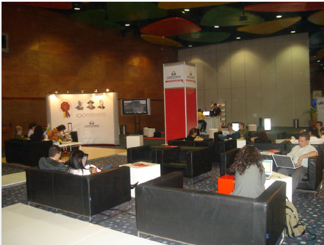
Ilustración 4 Sala lounge Evento.