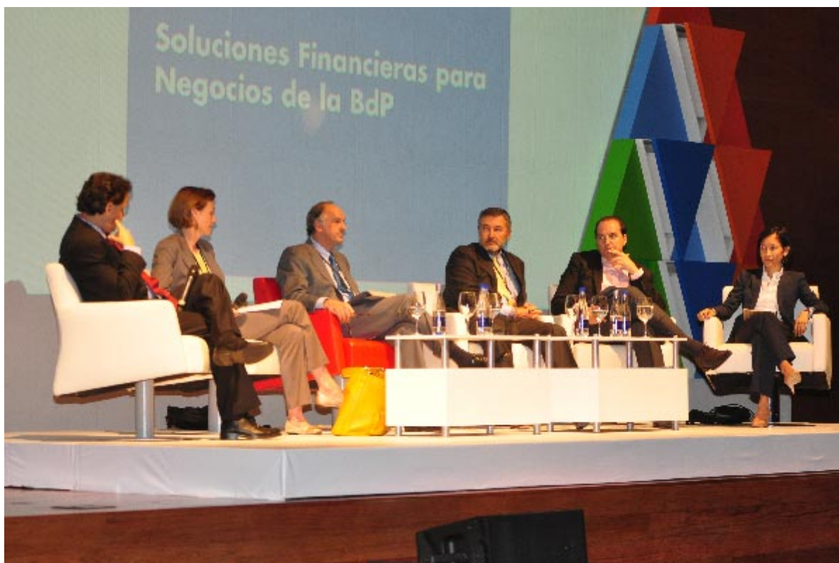
Ilustración 6 III Foro Base Internacional del BID.