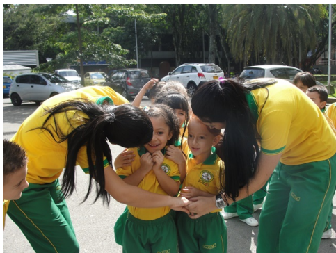
Ilustración 6 Actividad de motivación

Este planteamiento se apoya en lo propuesto por Jesús Beltrán en su libro; Psicología de la educación (1995. P, 83) en el cual se plantea que “la motivación para aprender hace referencia