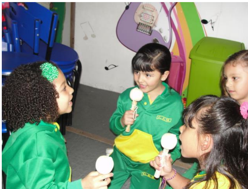
Ilustración 9 Actividad con pirinolas

Un ejemplo claro son los componentes estructurales que poseen las rondas y que nos hacen generar convivencia, con elementos como la interacción física, la agresión ritualizada, diálogos y conversaciones, ironías y sopesar la justicia como en el caso de la ronda: materilerilero, desarrollo y pulsión de las fuerzas, cómo el arranca yucas, juegos donde se aprende a ganar y a perder como: el trompo, a someterse al otro como las chuchas, a esperar el