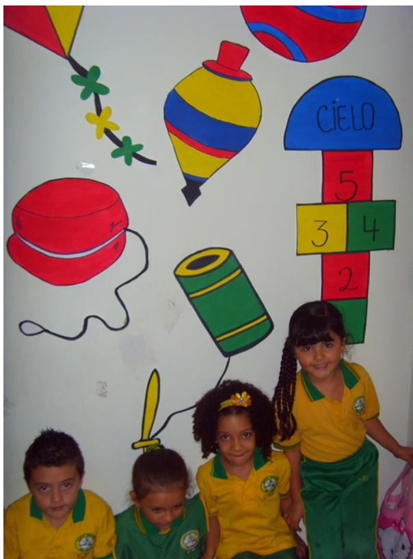
Ilustración 8 Trabajo inicial de reconocimiento de los juegos tradicionales

En los siguientes comentarios se puede evidenciar dichas reacciones de los niños frente a los elementos presentados en cada intervención: