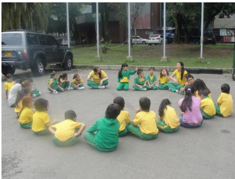
Ilustración 10 Trabajo de conocimiento de los juegos tradicionales

En la respuesta dada por los niños y las niñas se evidencia el conocimiento que ellos tienen frente a este tipo de juegos, además el interés que muestran por jugar y divertirse cada vez que tienen la oportunidad de compartir con otros compañeros.