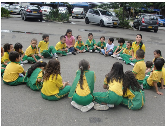
Ilustración 7 Actividades al aire libre

A lo largo de la intervención llamó la atención el interés que los niños y las niñas le ponían a cada actividad, principalmente a aquellas en donde se realizaron los trabajos al aire libre. Esto se debe a que el espacio del que disponen en la institución para el juego y la diversión es limitada y por lo general toda la programación de actividades de recreación y académicas son dentro de la institución, en específico dentro del aula, debido a que no se cuenta con un patio de recreo, por lo que las salidas realizadas en nuestra intervención les permitieron a los niños cambiar de ambiente y disfrutar de un espacio libre. Generando así una mayor predisposición, disfrute y recordación de las actividades. Un ejemplo de esto fueron los comentarios de los niños durante las visitas al polideportivo sur de Envigado: