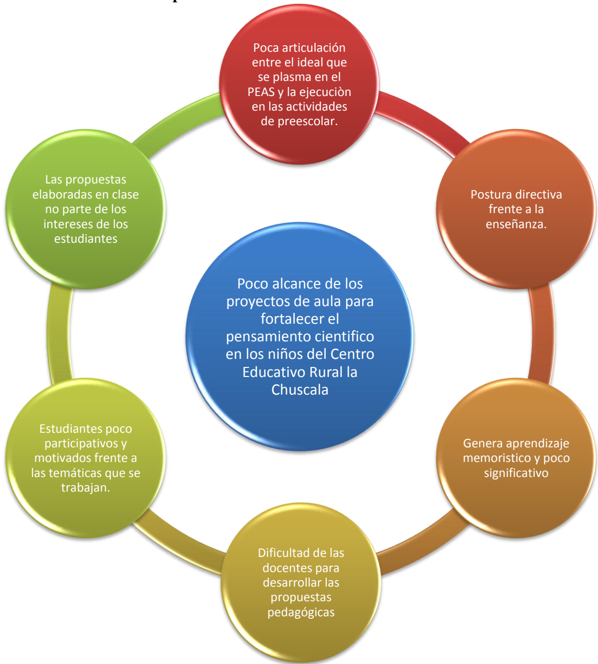
Ilustración 1 Árbol de problema