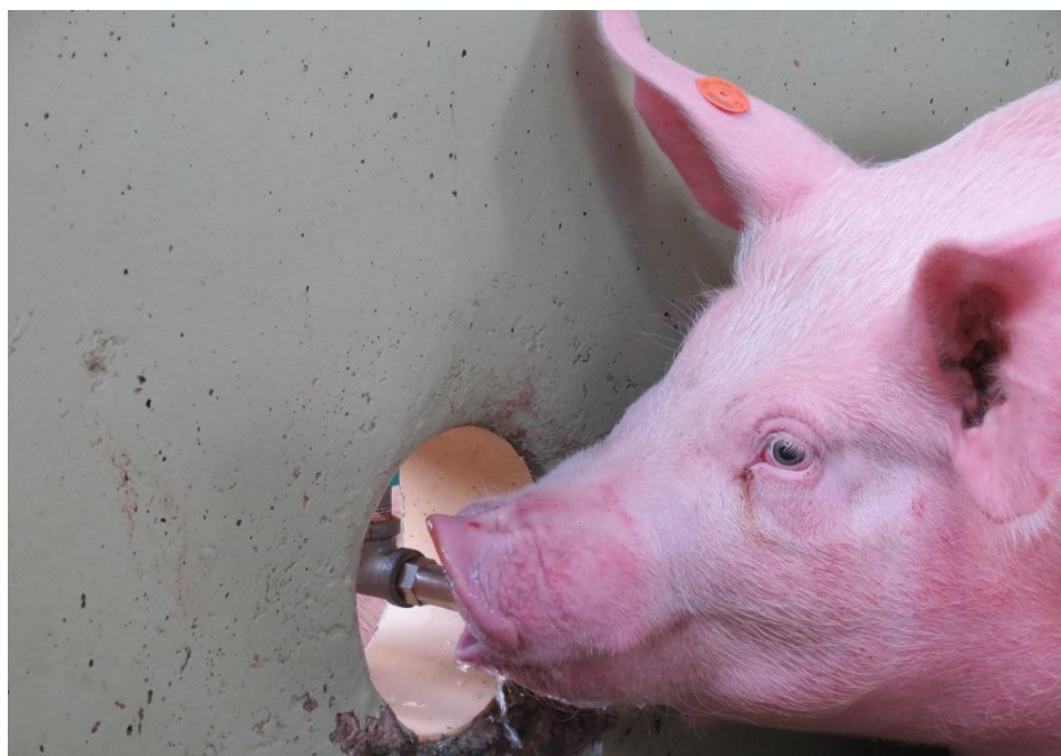
Ilustración 11: Hidratación de porcinos.