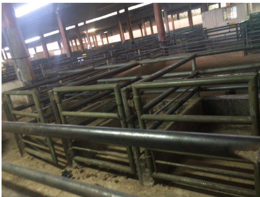
Ilustración 14: Corrales exclusivos para padrones.

Para propiciar confort y bienestar en el animal se debe garantizar un equilibrio entre su estado mental, físico y su comportamiento natural. El bienestar animal en porcinos es signo de productividad, es un valor agregado en calidad para el producto final, es confiabilidad por la aceptación y la buena percepción del consumidor.