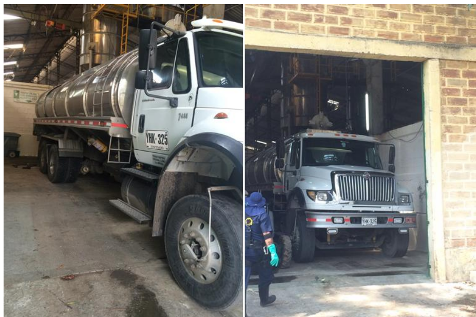
Ilustración 8: Morgue y traslado de cadáveres por AGROSAN S.A.

En el caso de hallar animales muertos en el momento de recepción dentro de los camiones y dentro de las instalaciones de la Feria De Ganados De Medellín, el cadáver del semoviente es decomisado y trasladado a la morgue donde la empresa AGROSAN S.A se encarga de su destino final y aprovechamiento (ver ilustración 6). Evitando con este proceso una posterior comercialización de estos animales los cuales no son aptos para el consumo humano.