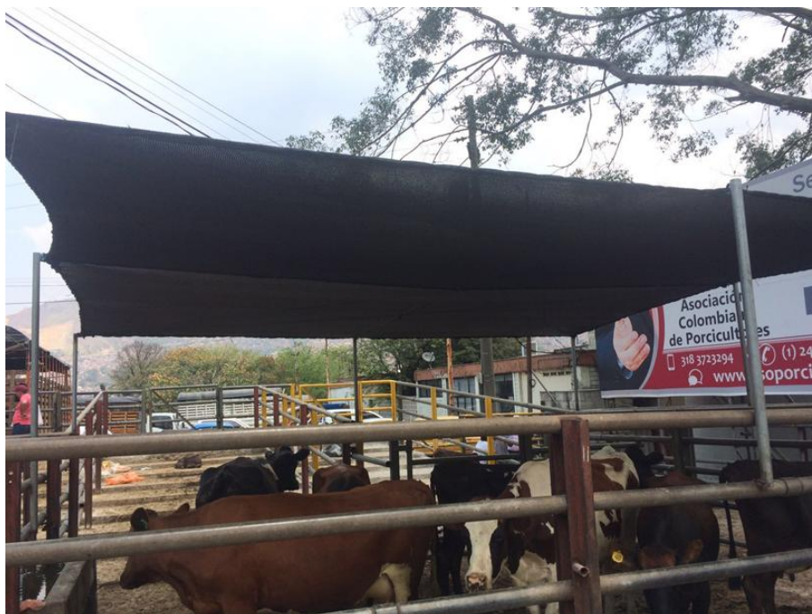
Ilustración 17: Adecuación de polisombras para cría.

En el caso de hallar animales muertos en el momento de recepción dentro de los camiones y dentro de las instalaciones de la Feria De Ganados De Medellín, el cadáver del semoviente es decomisado y trasladado a la morgue donde la empresa AGROSAN S.A le da su debida manipulación (ver ilustración 6). Evitando con este proceso una posterior comercialización de estos animales los cuales no son aptos para el consumo humano y tampoco para elaboración de subproductos derivados de proteína cárnica.