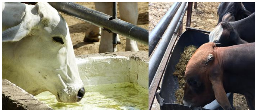
Ilustración 6: Hidratación y alimentación de los bovinos.