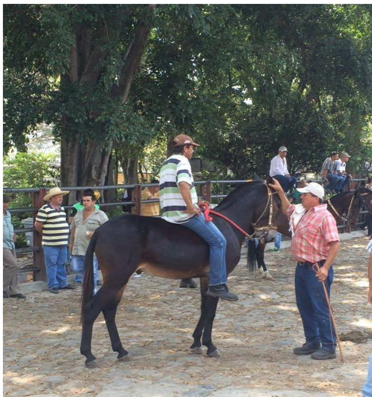
Ilustración 16: Comercialización de equinos.

En los desembarcaderos del sector de revoltura, hay adecuación con poli sombra para darle prioridad a las crías que ingresan durante la semana a la Feria de Ganados De Medellín (ver ilustración 15). A estas crías se les debe brindar cuidado especial, teniendo en cuenta que son animales que apenas comienzan su desarrollo fisiológico e inmune y están más susceptibles a