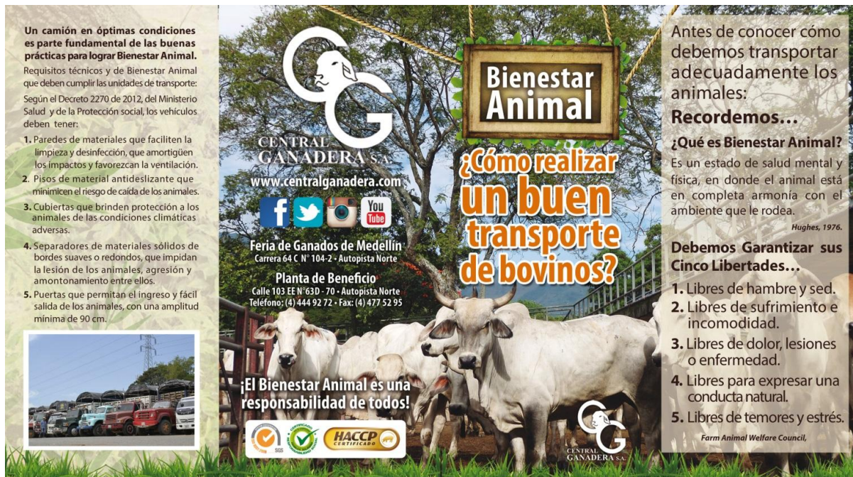
Ilustración 9: Campaña de sensibilización de bienestar animal en el transporte de bovinos.