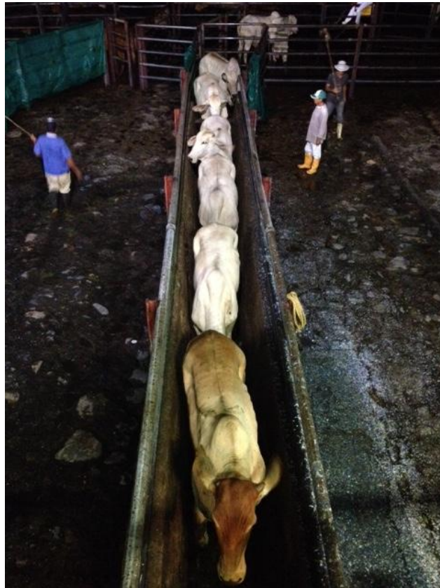
Ilustración 4: Ingreso adecuado de los bovinos a las básculas.

“La zona de fuga es el área que delimita la distancia hasta donde debe acercarse a un animal o a una manada sin generar ninguna reacción. Cuando penetramos esta zona los animales se alejarán de nosotros, esta es una presión no física que permite dirigir a un grupo de animales