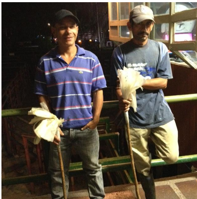
Ilustración 3: Inicio de la jornada laboral de los arrieros con su herramienta de trabajo adecuada.

La recepción de ganado bovino en los desembarcaderos se realiza por parte del personal operativo de la Central Ganadera. Por normativa a las instalaciones de la feria, sanidad e inocuidad y bienestar animal no deben ingresar animales enfermos, con heridas abiertas, lesiones que estén generando dolor, fracturados o con cualquier otro episodio que atente contra su integridad.