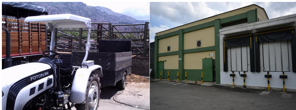
Ilustración 7: Tractor para la movilización de animales caídos y planta de beneficio de emergencia.

En el caso de hallar animales muertos en el momento de recepción dentro de los camiones y dentro de las instalaciones de la Feria De Ganados De Medellín, el cadáver del semoviente es decomisado y trasladado a la morgue donde la empresa AGROSAN S.A se encarga de su destino final y aprovechamiento (ver ilustración 6). Evitando con este proceso una posterior comercialización de estos animales los cuales no son aptos para el consumo humano.