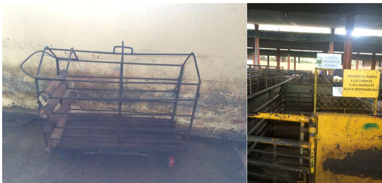
Ilustración 13: Corral de observación porcino.

Los padrones que ingresan a las instalaciones de la FERIA DE GANADOS DE MEDELLÍN, se recomienda que sean manipulados individualmente para evitar que lesione a otros animales e incluso a la persona que está a cargo de su manejo. Deben disponerse en los corrales que están diseñados exclusivamente para los padrones (ver ilustración 12), con hidratación y medidas adecuadas para su comodidad y bienestar.