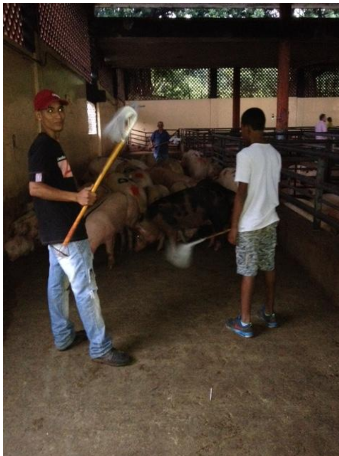
Ilustración 12: Manejo adecuado de los porcinos.

El manejo debe realizarse en grupos de varios animales, la recomendación es que sean grupos pequeños, de esta manera el control, desplazamiento y acceso a los corrales de los animales será menos complicado. Los cerdos no deben lastimarse por parte de la persona encargada, con ninguna herramienta de trabajo que altere su integridad física y mental. Los cerdos son animales sensibles cardiacamente, debido a esta condición agredirlos o gritarles