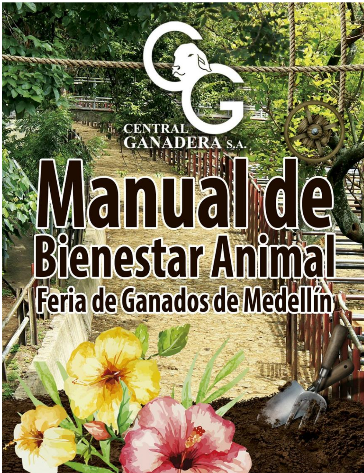
Ilustración 1: Portada del Manual de Bienestar Animal a entregar a la Feria De Ganados De Medellín.