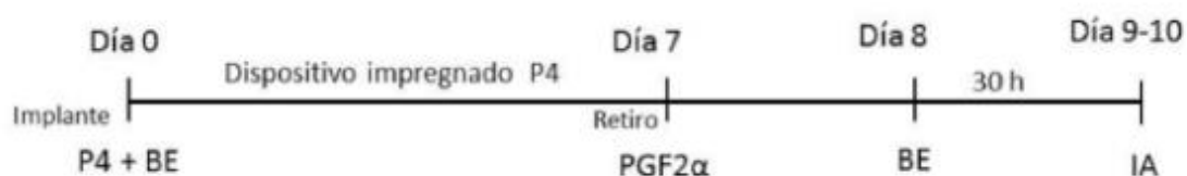
Ilustración 3. Protocolo de sincronización basado en progesterona y estradiol.