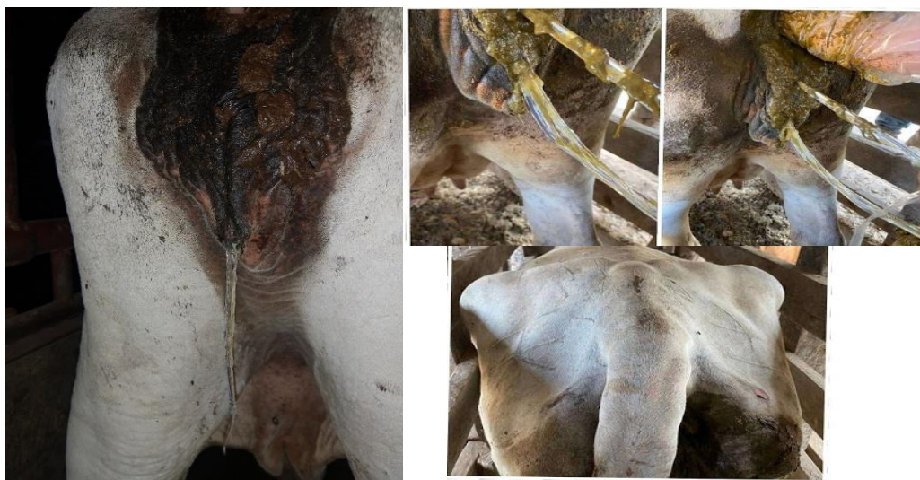
Ilustración 6 Signos de celo de los grupos BE y grupo CP.

En el grupo BE la tasa de gestación fue de 63% (19 vacas Brahman y 3 Senepol), mientras que en el grupo CPE fue del 40% (10 vacas Brahman y 4 Senepol), este resultado nos deja ver que el grupo 1, obtuvo una tasa de preñez más alta (tabla 7).