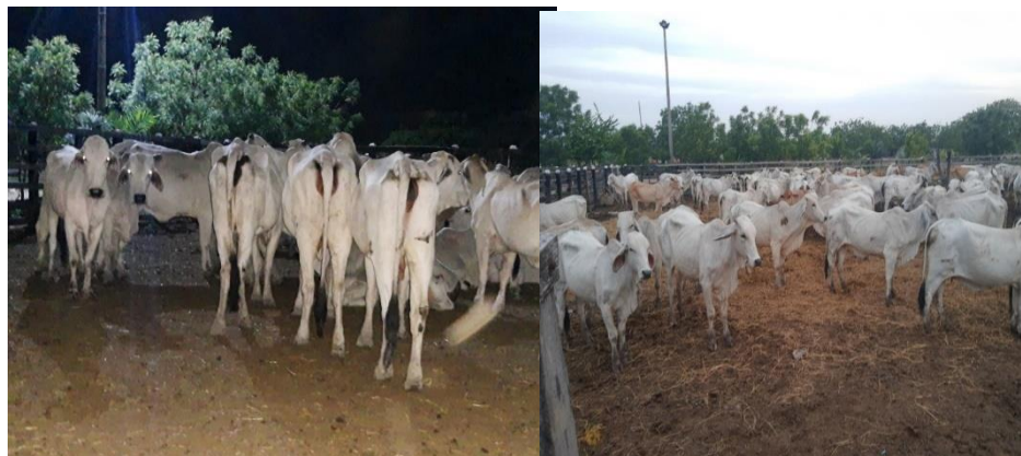
Ilustración 4 Vacas brahman usadas en los protocolos IATF