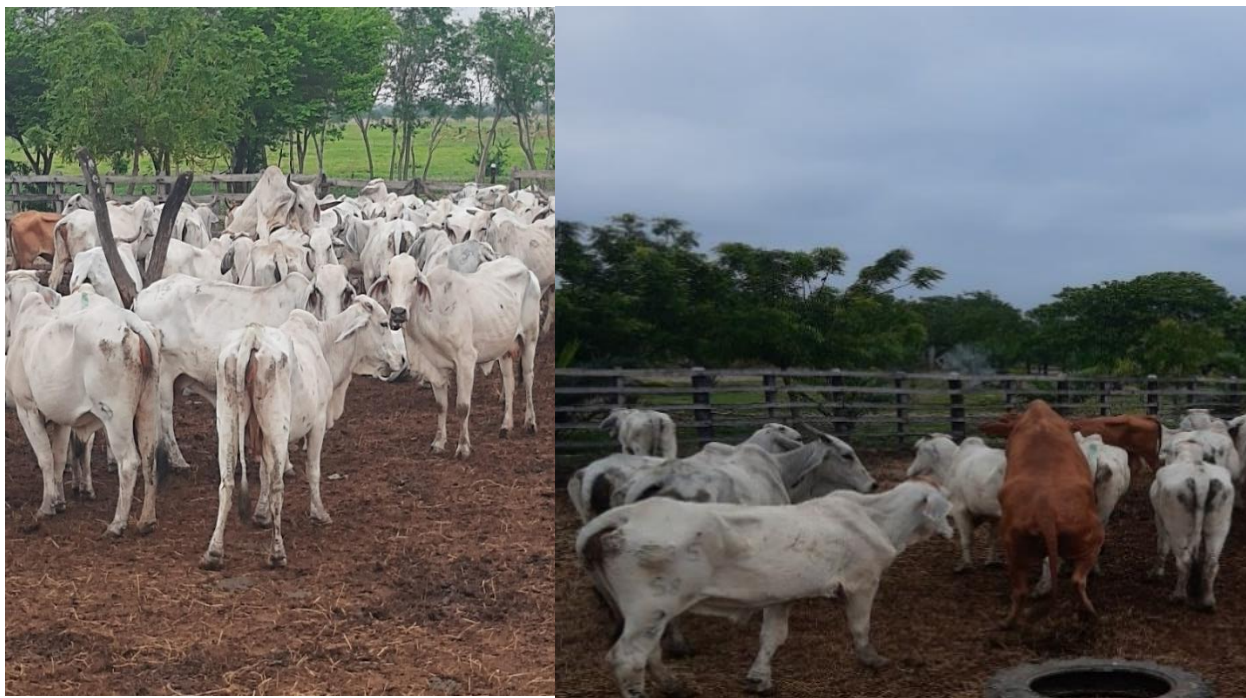
Ilustración 5 signos de celo durante la evaluación en vacas Brahman